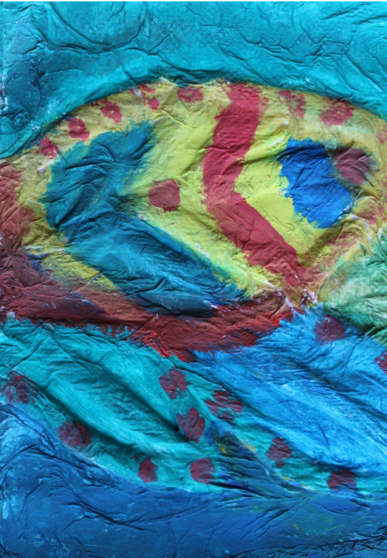
Reliéf – ryba