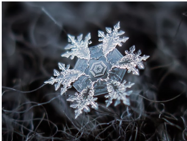
Mnohonásobne zväčšená snehová vločka