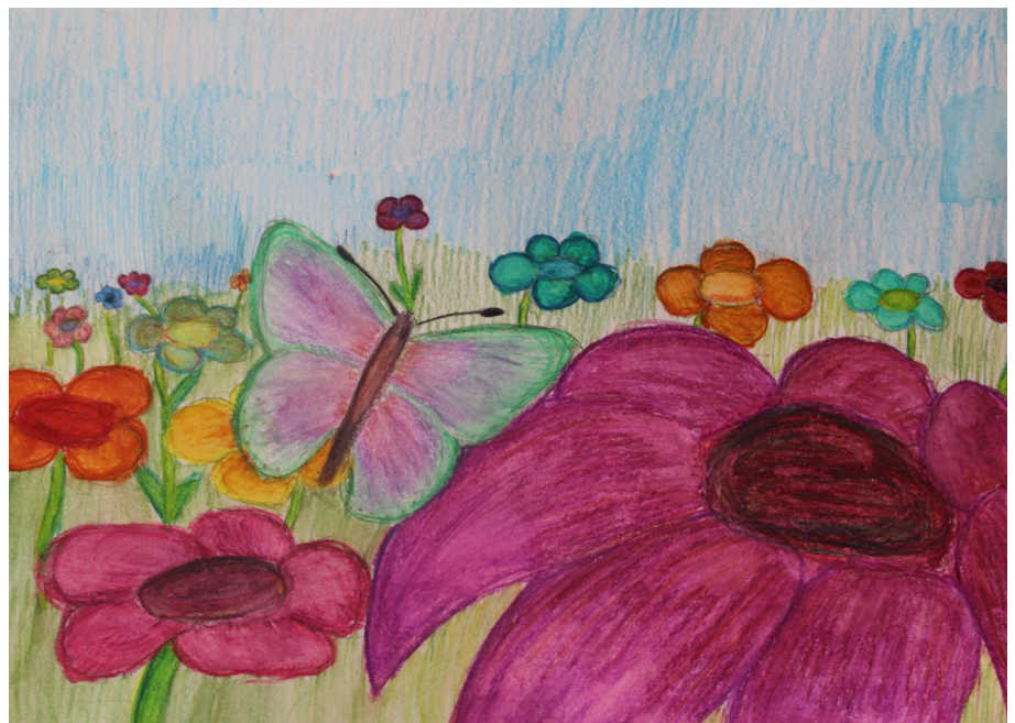
Motýľ na farebnej pláni