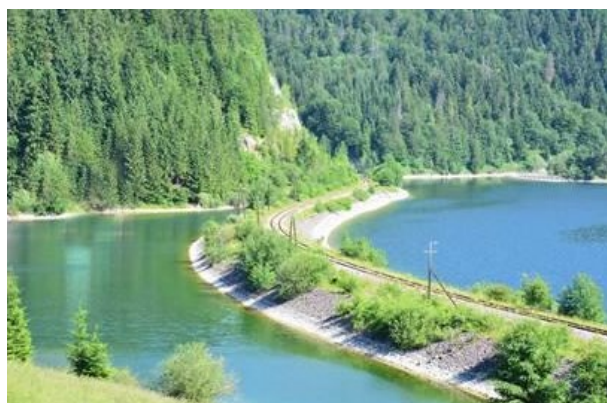
Železničný úsek na Palmanskej Maši

železničný úsek Červená skala - Margecany je považovaný za najkrajšiu železničnú trať na Slovensku? Táto jednokolejová železničná trať je zaujímavá dvoma viaduktmi a mnohými tunelmi, z ktorých najznámejším je celosvetový technický unikát, 1240 m dlhý špirálovitý Telgártsky tunel. Trať prechádza malebnou prírodou NP Slovenský raj, Volovských vrchov, Čiernej hory, Ružinskej priehrady, Nízkych Tatier, Muránskej planiny, Stratenskej doliny, doliny Hnilca a vodnej nádrže Palmanská Maša. Jej celková dĺžka je 95 km a postavená bola ako posledný úsek tzv. stredoslovenskej transverzály, ktorá mala spojiť košicko-bohuminskú železnicu s pohronskou železnicou.