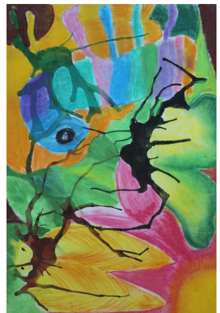
Ema Gombalová, VIII.B