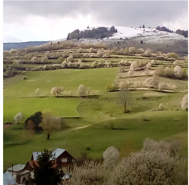
Hore zima, dolu jar