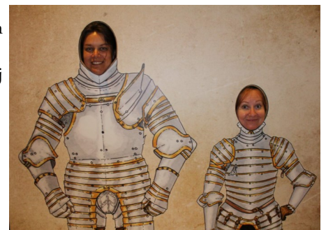
Pedagogická stráž :)