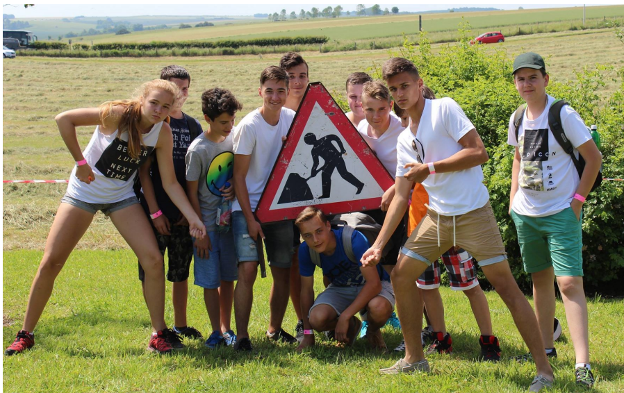
Vedľa informačnej kancelárie Stonehenge

Na druhý deň sme sa všetci tešili, pretože nás čakal tajomný Stonehenge. Cestu sme si krátili rozprávaním o rodinách a ani sme sa nenazdali, ako rýchlo ubehla. Prišli sme na miesto a začali sme hrať terajšiu populárnu hru „Zem je láva“. Vystáli sme si dlhý rad a dostali sa na malinký autobus, ktorý nás odviezol priamo k Stonehengu. Videli sme tie povestné skaly, urobili si mnoho umeleckých aj neumeleckých fotiek a vrátili sme sa späť. Zabávali sme sa s atrakciou, kde išlo o akože ťahanie kameňa podobného tým zo Stonehengu. Z celého výletu sa nám aj tak najviac páčila značka, ktorá ukazovala, že sa tam kope, s ktorou sme si tiež spravili vtipnú fotku.