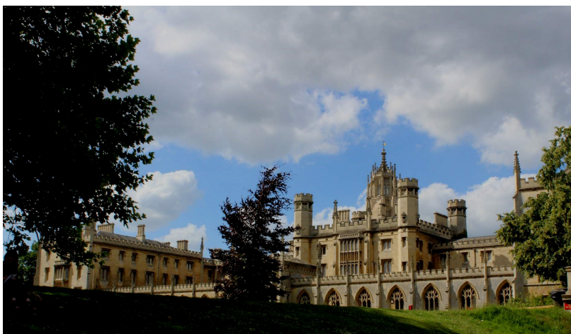
Takto vyzerá internát v Cambridgi :)