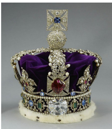
Jedna z mnohých kráľovských korún, ktoré sme videli v Tower of London, táto je používaná aj terajšou kráľovnou