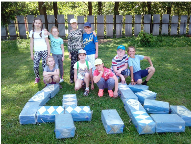
Keby tak štvrtáci vedeli, že s týmito istými polystyrénovými drakmi kedysi niektoré ich maminky cvičili na spartakiáde :)

20. máj – Deti z turistického oddielu 1.ZŠ Hriňová Kašupierova topánka zdolali najvyšší bod Hriňovej, najvyššej sopky Slovenska – Poľany – Zadnú Poľanu 1458 m. Videli krásne karpatské pralesy, doliny, vodnatý závoj vodopádu Bystrô, salamandry, sokoly, užovky, nádherné výhľady, skalné bralá, kráter sopky, zurčiacie jarky, pamätník partizánom. V zdraví sa vrátili domov a odnášajú si kopec krásnych zážitkov.