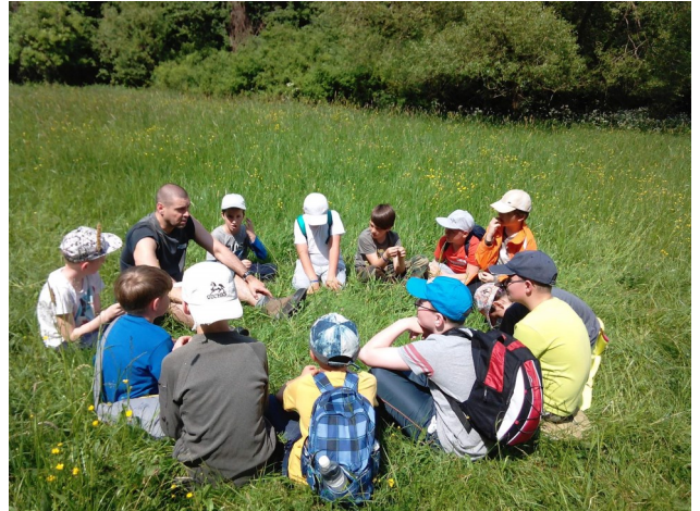
Fotografia zo školy v prírode

na čo byť dobrý? Čo z toho mám? Našťastie nie všetko je merateľné peniazmi. Nemali by sme vždy za niečo čakať nejakú odmenu. Urobme niečo len tak, aby sme pohladili svoje svedomie, a uvidíte, odmena sa dostaví veľmi rýchlo. Bude iná... Bude ukrytá za slovami, ktoré nám zadarmo venuje niekto iný. Pocit šťastia za pomoc inému má až magickú silu a to čo nás vo vnútri zaplaví je naozaj ako by sme snívali, ale len tie najkrajšie sny :-). Toto je ten obyčajný svet... Aké jednoduché a pritom pre niekoho možno náročné... Aké ľahké je sa z niekoho vysmievať, zosmiešňovať a ponižovať, ovplyvňovať životy iných cez sociálne siete, žiť vo falošných ilúziách podivných priateľstiev, kde počet smajlíkov, lajkov určuje hodnotu človeka. Je toto ten správny svet? Určite nemá ružovú farbu... Byť arogantní k iným nám svedomie do ružova nesfarbí... Skúsme byť jednoducho len ľuďmi, nehrajme sa na niečo, čo nie sme, vsaďme na ľudskosť a na priateľstvo. Nech je tých priateľov menej, ale nech nás nakazia dobrotou a ľudskosťou, pretože tá nám akosi čím ďalej viac a viac chýba.... Potom náš svet bude určite ružový... :-)