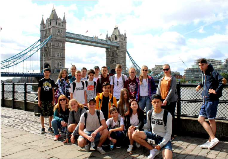
Lazníci – krycie meno našej skupinky – pred Tower bridge

Po Katedrále nás už čakala len Oxford Street, na ktorú som sa už naozaj veľmi tešila. Žiaľ, stratili sme takmer hodinu, kvôli autobusom, ktoré nás nemohli zobrať, kvôli lístkom, no nakoniec sme sa tam aj tak dostali. Hneď ako zaznelo slovo rozchod, všetci sa rozbehli do obchodov. Tašky boli plné, peňaženky prázdne a nálada výborná. Unavení z celého týždňa sme sa vybrali opäť na metro, ktoré nás dopravilo k autobusu a mohli sme hrdo opustiť nádherný Londýn.