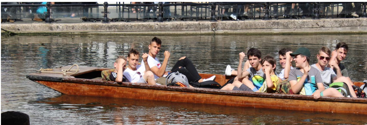
Plavba loďkami po rieke Cam v Cambridge

Tretí deň patril sídlu Windsor, kde bolo naozaj nádherne. Videli sme domček pre báby samotnej kráľovnej a vlastne celé jej víkendové sídlo. Výhľad bol krásny a všetci sme boli unesení celkovou atmosférou. Poobede nás čakal výlet do mesta Cambridge. Plavili sme sa na malých drevených loďkách a okolo seba sme videli mnoho prestížnych fakúlt univerzity. Všade boli kačičky, labute či iné zvieratká a veľmi sme sa z toho tešili. Presunuli sme sa k jednej z fakúlt (King`s College), kde sa tiež natáčal Harry Potter, konkrétne metlobal. Neskôr sme si mohli nakúpiť a trochu pohodovo si užiť atmosféru mesta. Pre mňa to veľká pohoda nebola, pretože som sa (pochopiteľne) stratila v nákupnom centre, resp. nechali ma tam naši úžasní chlapi. Našťastie som ich našla a už som sa od nich nepohla. Večer sme sa opäť vrátili na autobus a cestovali do rodín. Cestou domov sa nám stalo niečo zaujímavé, čo sa nám ešte nikdy nestalo. Cúvali sme na diaľnici, pretože sme netrafili odbočku. Hlavne bezpečne, však? Našťastie sa nikomu nič nestalo a my sme spokojne dorazili do rodín, kde sme si užili poslednú večeru. V Londýne.